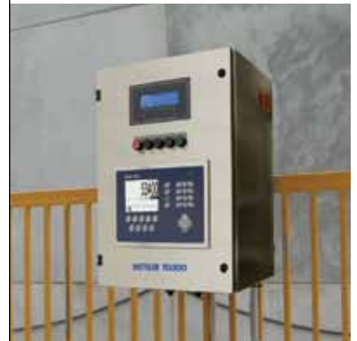
철도 스케일 제어기

기차가 스케일을 이동함에 따라 레일 카 ID 및 중량 정보를 자동 캡처하는 제어기를 통해 이동 중 계량을 단순화하십시오. 제어기는 수백 대의 기차에 대한 데이터를 저장하면서 중량 정보를 기록하고 인쇄합니다.