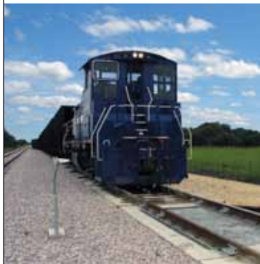
이동 중 계량

CIM(연결 이동 중 계량) 철도 궤도 스케일은 서로 연결되어 3 - 5 mph(5 - 8 km/hr)의 속도로 스케일을 이동하는 레일 카를 계량하는데 사용됩니다. 이 스케일은 각 레일 카를 분리하여 정적 스케일에 배치할 필요가 없어 계량이 보다 빨라지고 안전해집니다.