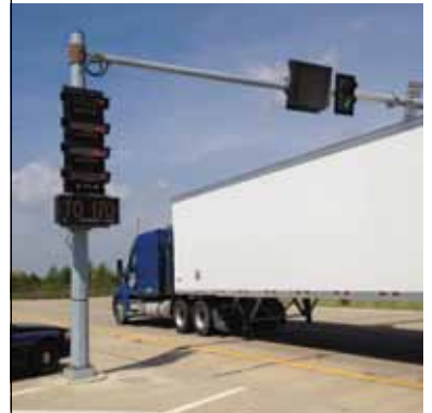
멀티 플랫폼 스케일

멀티 플랫폼 스케일은 개별 축 중량 및 차량 총 중량을 측정하기 위해 일련의 독자적인 플랫폼을 사용합니다. 이 스케일은 법적 거래 승인 계량은 물론 트럭이 고속도로 중량 한계를 준수하는지 검증하는 단일 단계의 빠른 분석법을 제공합니다.